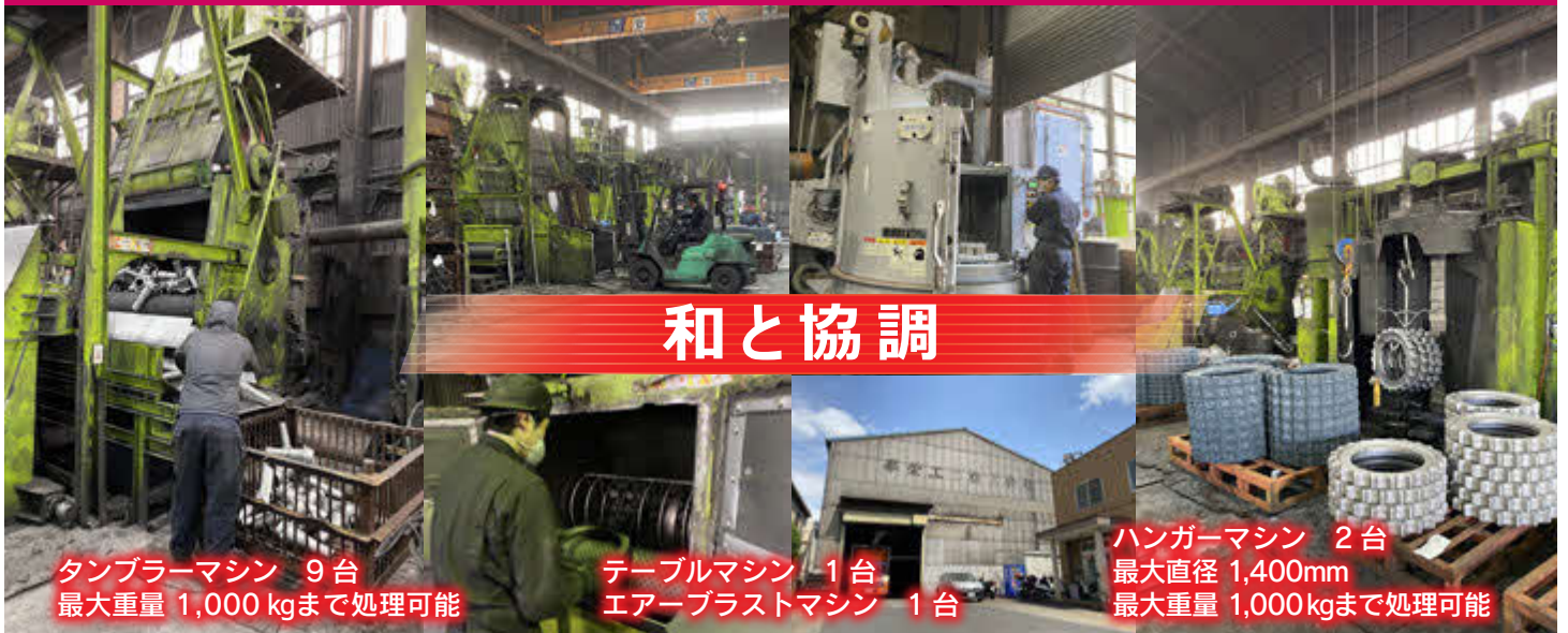
タンブラーマシン 9台 最大重量 1,000 kgまで処理可能